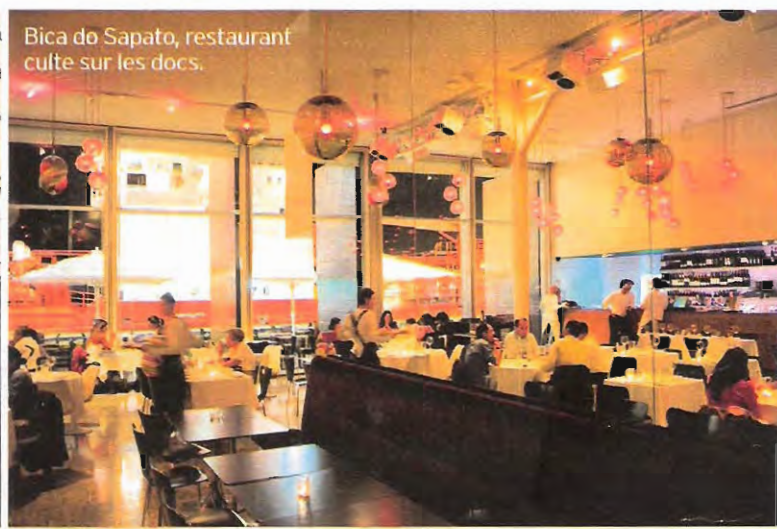
Bica do Sapato, restaurant culte sur les docs.