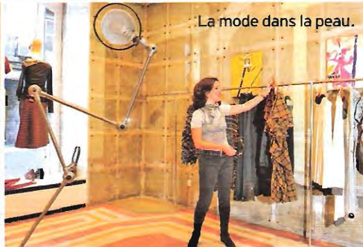
La mode dans la peau.

Chiado et le Baixa avant de partir à l'assaut de l'Alfama et de parcourir les ruelles populaires de Graça. Si j'ai envie d'une fête monumentale, je marche jusqu'au Bairro Alto, quartier de la presse, des bars et du fado. Mieux vaut éviter les talons trop hauts, à cause des rues qui montent et descendent sans cesse et des pavés. C'est animé jusqu'à l'aube, même en semaine. Jean-Paul Gaultier s'y balade souvent et John Malkovich y dînait tous les soirs lors du tournage du « Couvent » de Manoel de Oliveira. L'autre quartier branché, mais plus confidentiel, c'est Bica, le long du funiculaire qui relie le vieux port au haut de la ville : actrices, journalistes et musiciens s'y retrouvent. Dans la zone de prostitution du vieux port, à Cais Do Sodre, d'anciens bars d'entraîneuses ont été transformés en boîtes de nuit. Des show-cases ou des afters grands comme des mouchoirs de poche, très intimistes. Le Tout-Lisbonne s'y précipite. ■