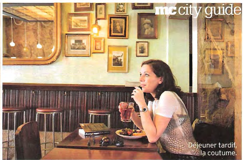
Déjeuner tardif, la coutume.