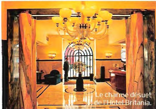
Le charme désuet de l'Hotel Britania.