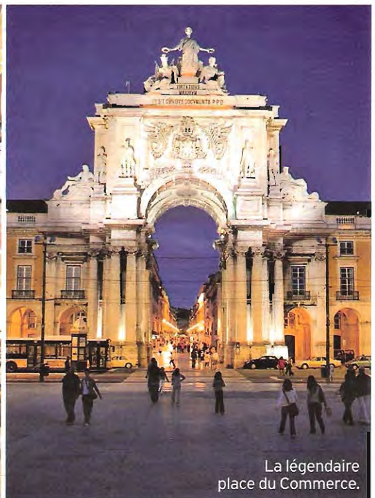
La légendaire place du Commerce.