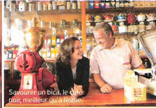
Savourer un bica, le café noir, meilleur qu'à Rome.