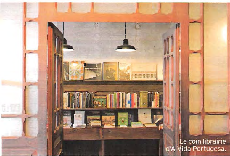
Le coin librairie d'A Vida Portuguesa.