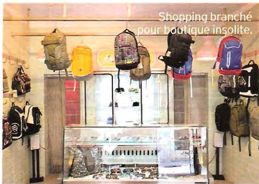
Shopping branché pour boutique insolite.