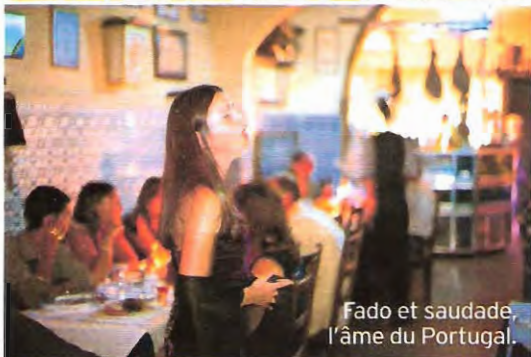
Fado et saudade, l'âme du Portugal.