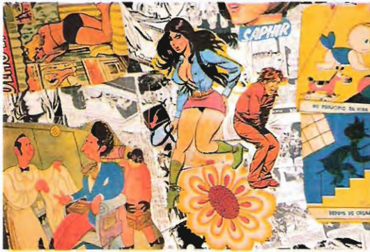
« A Vida Portuguesa, ma fabrique de souvenirs. »