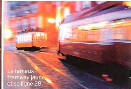
Le fameux tramway jaune et sa ligne 28.

► Vers 13 heures je déjeune au Vertigo ou au Café Royal. L'après-midi j'enchaîne les rendez-vous avec des fournisseurs ou je fais du shopping à la Fashion Clinic. Au printemps, c'est la fête des Sardines, une semaine très hype. Ici un simple balcon peut faire office de bar, et les gens sont vite dans la rue, un verre de caipirinha à la main. Quand je ferme le magasin, je dîne chez Pap' Açorda ou au Bica do Sapato, vers 21 heures. Puis la nuit commence : concerts, vernissages... Si je veux écouter du fado, je vais à Mesa de frades (La Table des moines), une ancienne chapelle dans l'Alfama où se réunissent les meilleurs fadistas. Les artistes chantent entre eux jusqu'à 6 heures du mat. L'Alfama est le plus vieux quartier de la ville, il en dit long sur l'âme portugaise, j'adore me perdre dans ses ruelles étroites. Pour avoir un aperçu d'ensemble de Lisbonne, l'idéal est de prendre le tram 28, qui part du château Saint-Georges, plonge vers le