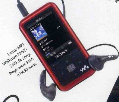
Leitor MP3 Walkman NWZ-S610 da Sony. Preço: entre 94,90 e 134,90 euros.