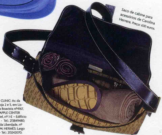
Saco de cabine para acessórios de Carolina Herrera. Preço: 630 euros.