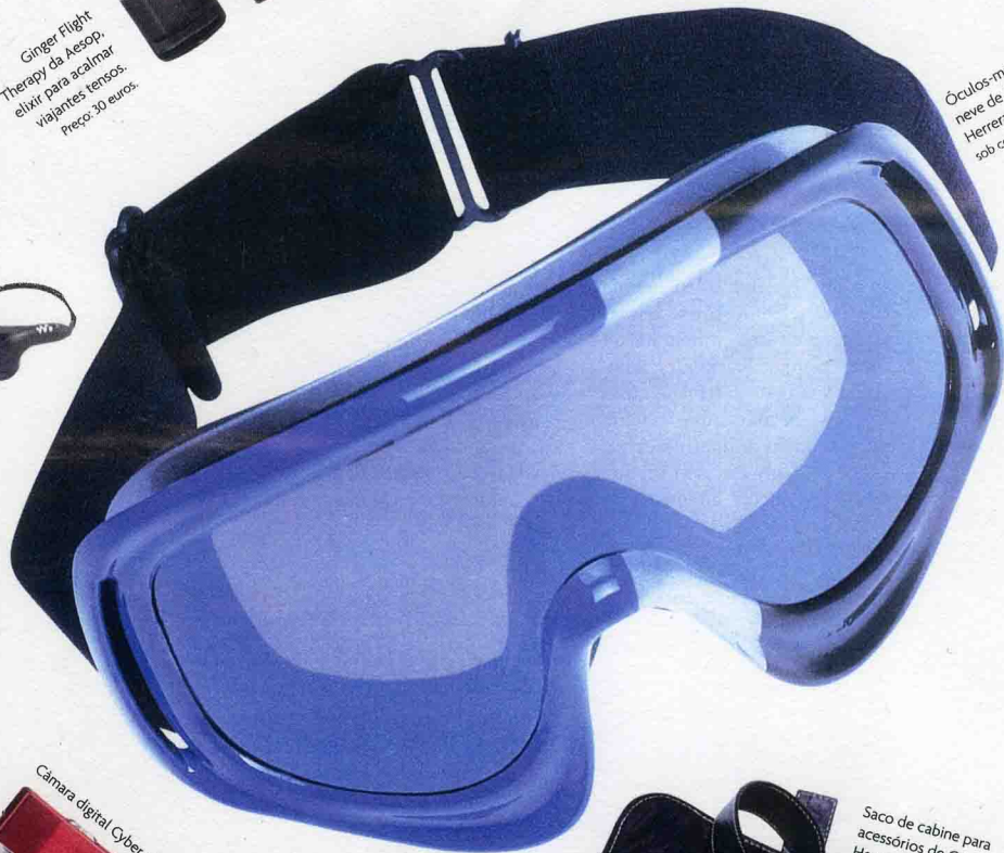
Óculos-máscara de neve de Carolina Herrera. Preço sob consulta.