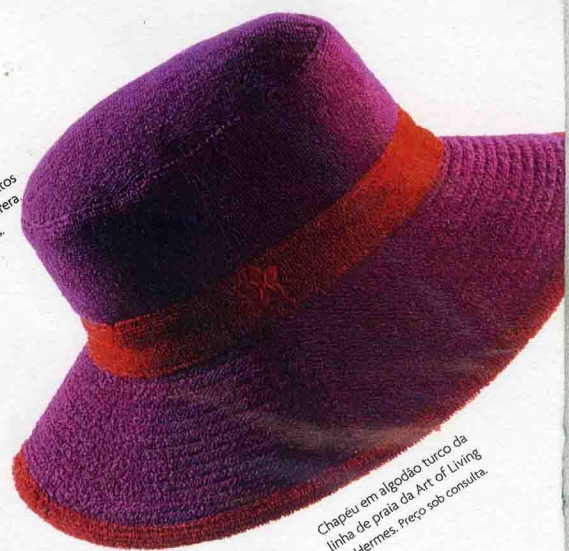
Chapéu em algodão turco da linha de praia da Art of Living de Hermes. Preço sob consulta.