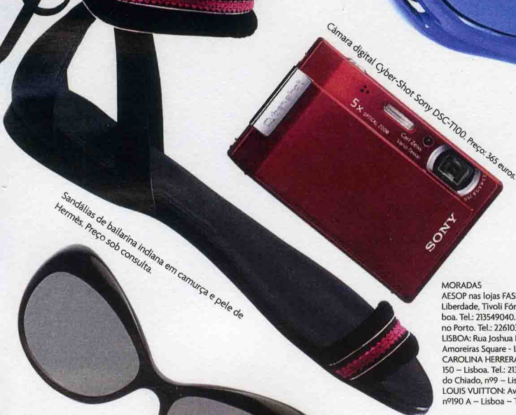
Câmara digital Cyber-Shot Sony DSC-T100. Preço: 365 euros.