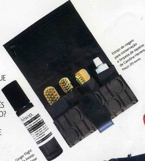
Estojo de viagem para conservação e limpeza de sapatos de Carolina Herrera. Preço: 210 euros.