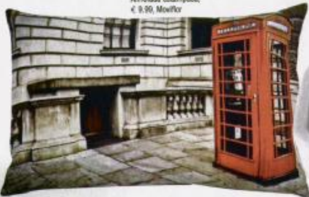
Almofada estampada, € 9,90, Mowlor