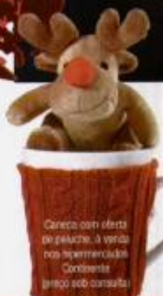
Caneca com oferta de gelado. À venda nos supermercados Condielita (preço sob consulta)