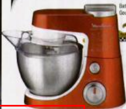
Batedeira Masterchef Gourmet, € 230, Moulinex