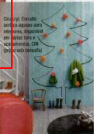
Glucery, Esmalte artístico líquido para interiores, disponível em várias tons e acabamentos, CEM (preço sob consulta)