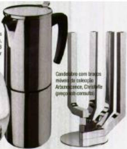
Candeeiro com braços móveis da coleção Arborecance, Christie (preço sob consulta)