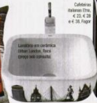
Lavatório em cerâmica (Urban London, Foces (preço sob consulta)