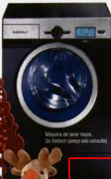
Máquina de lavar roupa, De Dietrich (preço sob consulta)