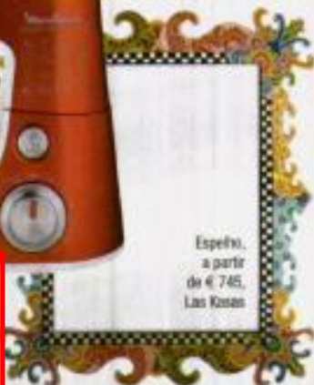
Espelho, a partir de € 745, Las Rozas