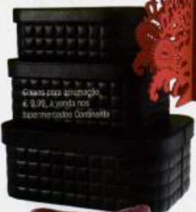
Calças para decoração, € 9,90, à venda nos supermercados Condielita