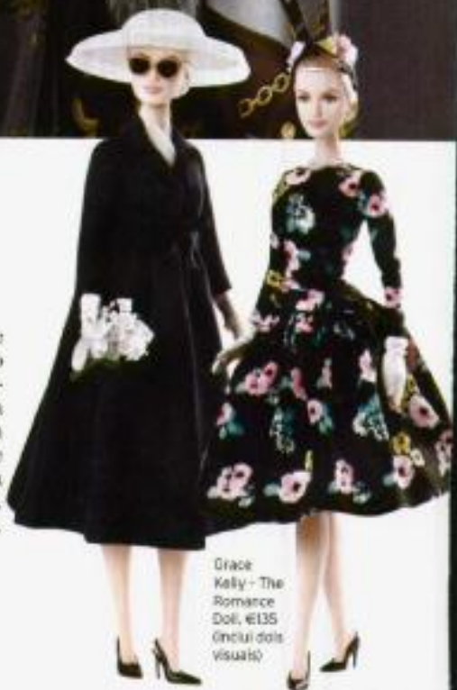
Grace Kelly - The Romance Doll, €135 (inclui dois visuais)