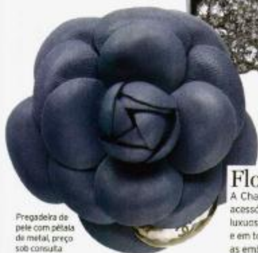
pregadeira de pele com pétala de metal, preço sob consulta