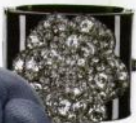
pulseira de resina com cristais, preço sob consulta